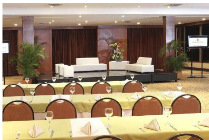
Salón Farallones – Piso 9. Plenaria.