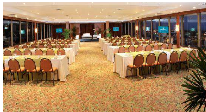
Salón Farallones – Piso 9. Plenaria.

https://www.hotelesestelar.com/es/destinos/colombia/cali