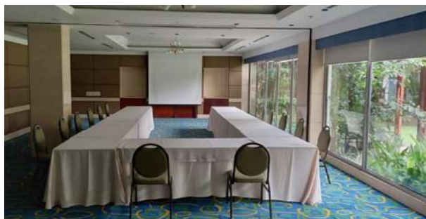
Salón Palmeras – Piso 1. Grupo 1. Uso de tecnología en la impartición de justicia.