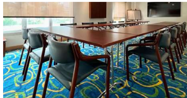
Salón Pance – Piso 2. Grupo 2. Gestión penal para delitos de alta complejidad