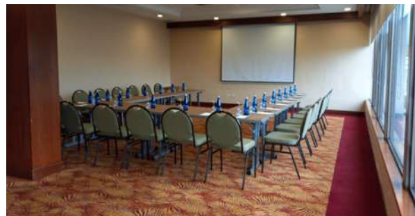
Salón Cali – Piso 9. Grupo 4. La transparencia judicial, la confianza y la proximidad con las personas y los medios.