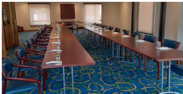
Salón Rio Lili – Piso 2. Grupo 3. Perspectiva de género e interseccionalidad en el servicio judicial