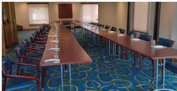
Salão Rio Lili – 2º andar. Grupo 3. Perspectiva de género e interseccionalidade no serviço judicial.