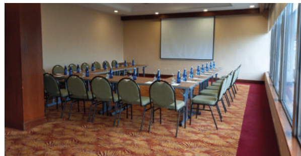
Salão Cali – 9º andar. Grupo 4. A transparência judicial, a confiança e a proximidade com as pessoas e os meios.