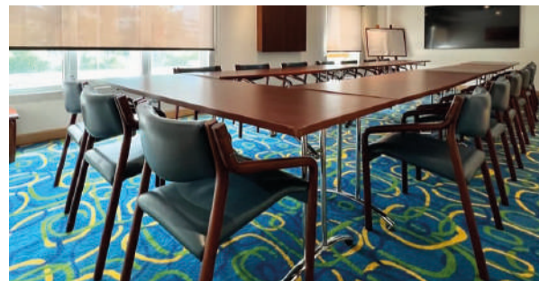
Salão Pance – 2º andar. Grupo 2. Gestão penal para crimes de alta complexidade.