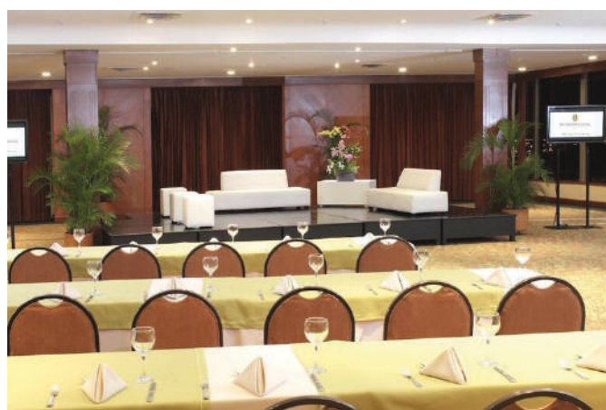
Salão Farallones – 9 ° andar. Plenária.