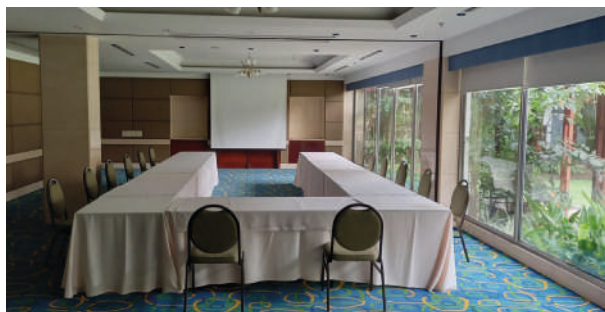
Salão Palmeras – 1º andar. Grupo 1. Uso de tecnologia na aplicação da justiça.