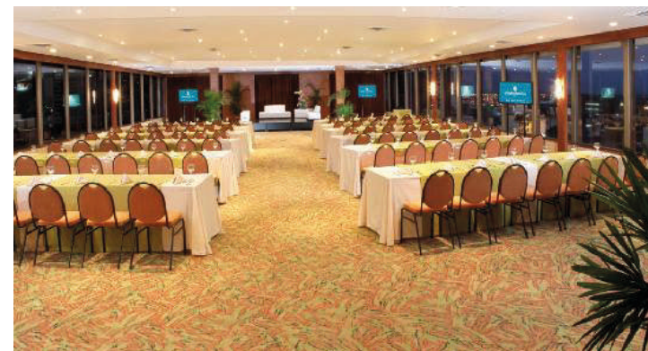
Salão Farallones – 9 ° andar. Plenária.

https://www.hotelesestelar.com/es/destinos/colombia/cali