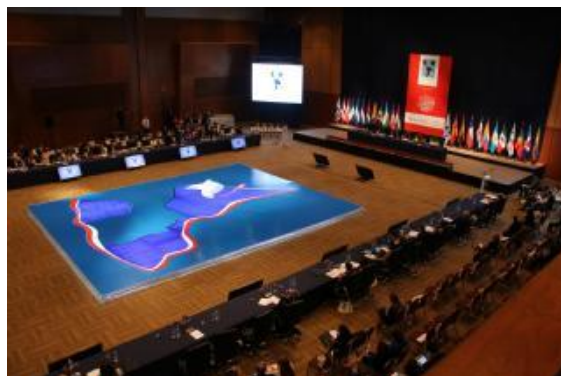
Asamblea Plenaria de la XVIII Cumbre Judicial Iberoamericana. Asunción, Paraguay, Abril de 2016

La Cumbre Judicial Iberoamericana es una organización que articula la cooperación y concertación entre los Poderes Judiciales de los veintitrés países de la comunidad iberoamericana de naciones, aglutinando en un solo foro a las máximas instancias y órganos de gobierno de los sistemas judiciales iberoamericanos. Reúne en su seno a los Presidentes de las Cortes Supremas y Tribunales Supremos de Justicia y a los máximos responsables de los Consejos de la Judicatura iberoamericanos.