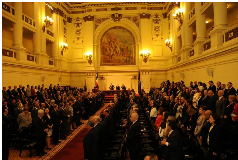
Asamblea Plenaria de la XVII Cumbre Judicial Iberoamericana. Santiago de Chile, Abril de 2014