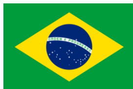
Bandeira do Brasil