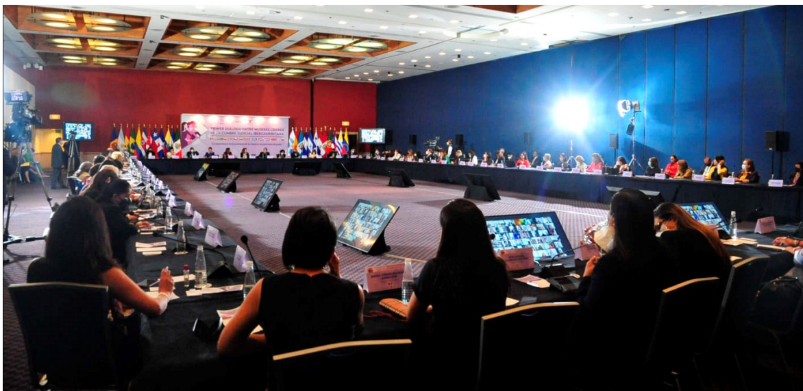
Primera Reunión Preparatoria - Ciudad de México, México 2022

El presente documento está destinado a proveer al lector de información básica o introductoria sobre la Cumbre Judicial Iberoamericana.