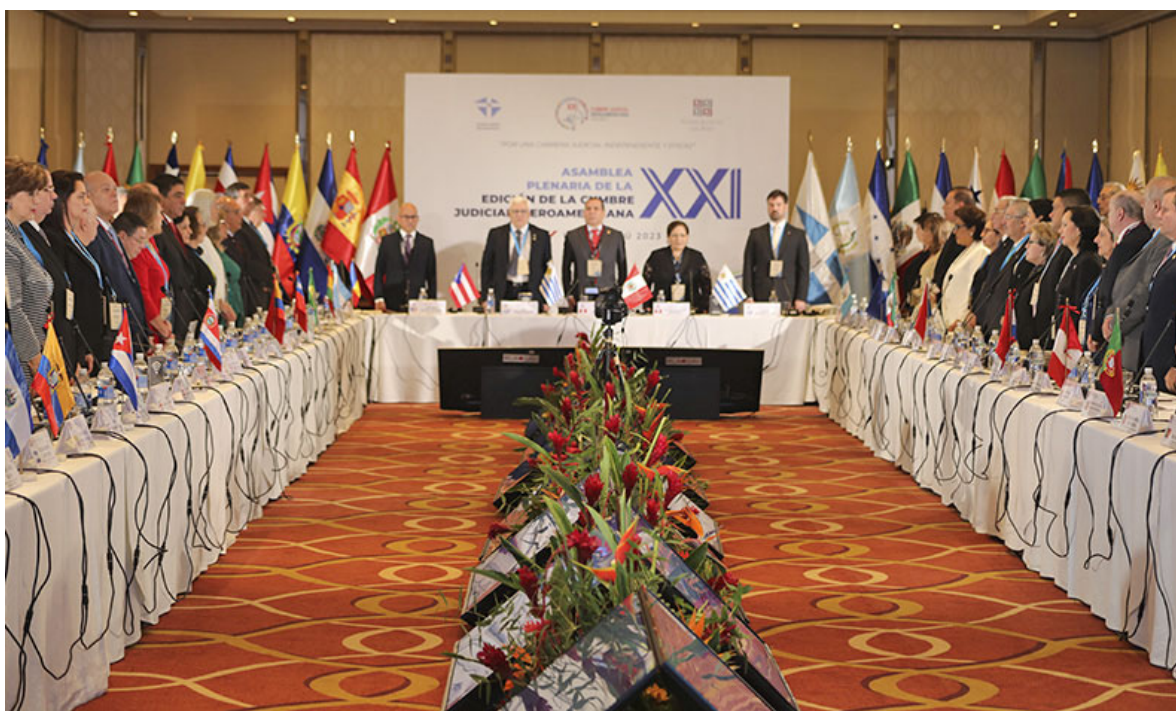
Asamblea Plenaria de la XXI Cumbre Judicial Iberoamericana. Lima, Perú, setiembre de 2023

La Cumbre Judicial Iberoamericana es una organización que articula la cooperación y concertación entre los Poderes Judiciales de los veintitrés países de la comunidad iberoamericana de naciones, aglutinando en un solo foro a las máximas instancias y órganos de gobierno de los sistemas judiciales iberoamericanos. Reúne en su seno a los Presidentes de las Cortes Supremas y Tribunales Supremos de Justicia y a los máximos responsables de los Consejos de la Judicatura iberoamericanos.