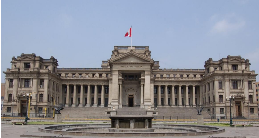
Palacio de Justicia

Las actividades de la Primera Reunión Preparatoria se desarrollarán en las instalaciones del Poder Judicial, ubicado en Avenida Paseo de la República S/N Palacio de Justicia, Cercado, Lima – Perú.